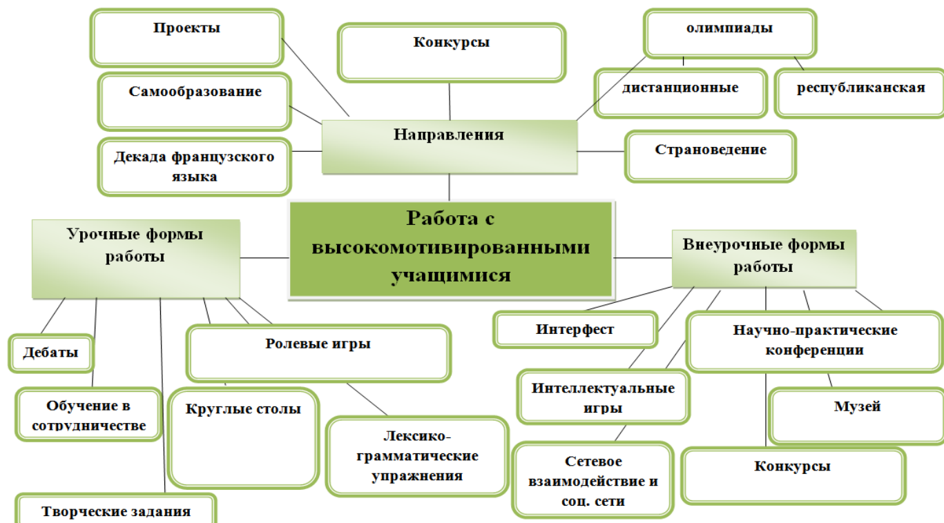
Рис. 1. Модель по работе учителей гимназии с высокомотивированными учащимися